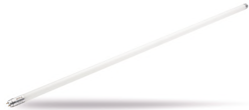
لامپ مهتابی 8 تی LED T8 U2