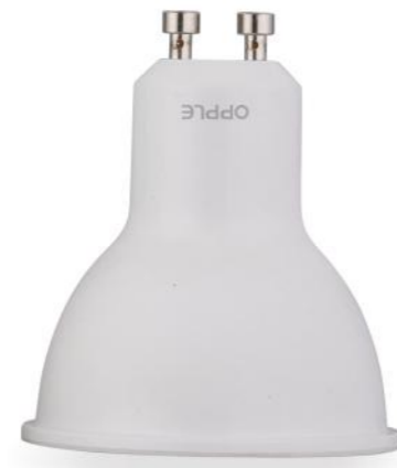
لامپ جی یو 10 LED E2 GU10