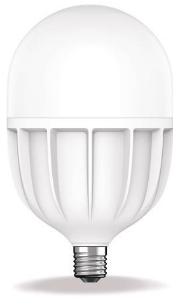
لامپ اكو سيو LED ECO SAVE