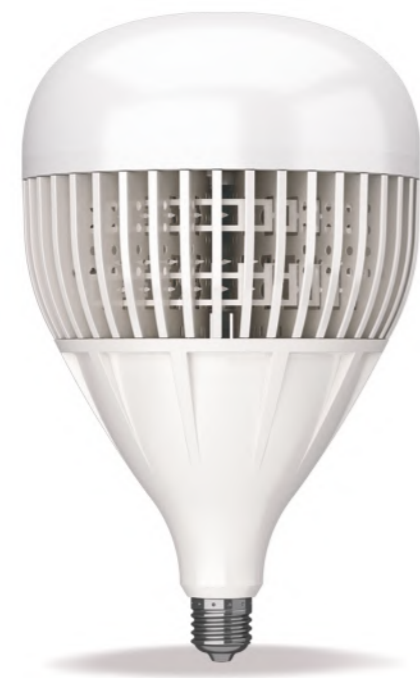
لامپ سوله‌ای ای-اس-1 LED ES 1