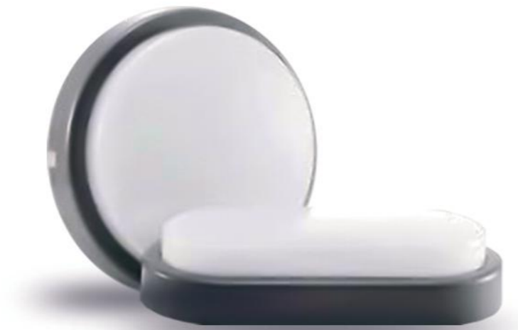
چراغ ديوارى اى LED BULKHEAD E