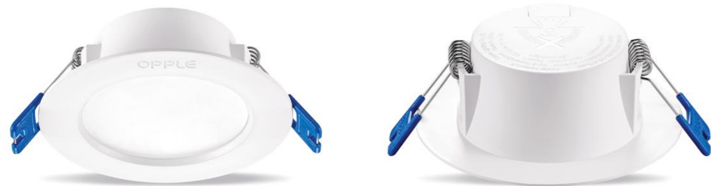
چراغ دانلايت يو-اس LED DOWNLIGHT US