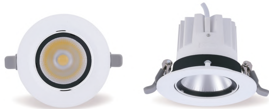
چراغ اسپات ایچ-جی LED SPOT RA HJ