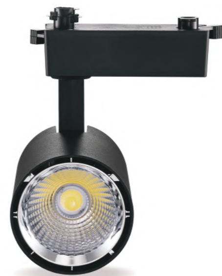
چراغ اسپات ترک_یو_2 LED SPOT TR U11