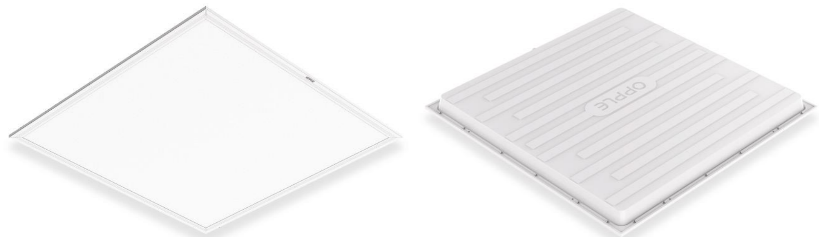
پنل بک لایت یو_3 LED PBL UIII